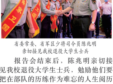
省委常委、省军区少将司令员陈兆明

“行”、中国特色社会主义为什么“好”的答案，深深书于神州大地的沧桑巨变中，镌刻在亿万人民的美好生活中，为中华民族作出了伟大历史贡献。党的百年奋斗史，之所以能够取得革命、建设、改革成功，有一条熠熠生辉、贯穿始终的红线，就是对共产主义的远大理想的信仰忠诚，近代以来久经磨难中华民族实现了站起来、富起来到强起来的历史性飞跃。