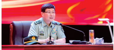
省委常委、省军区少将司令员陈兆明做报告

“行”、中国特色社会主义为什么“好”的答案，深深书于神州大地的沧桑巨变中，镌刻在亿万人民的美好生活中，为中华民族作出了伟大历史贡献。党的百年奋斗史，之所以能够取得革命、建设、改革成功，有一条熠熠生辉、贯穿始终的红线，就是对共产主义的远大理想的信仰忠诚，近代以来久经磨难中华民族实现了站起来、富起来到强起来的历史性飞跃。