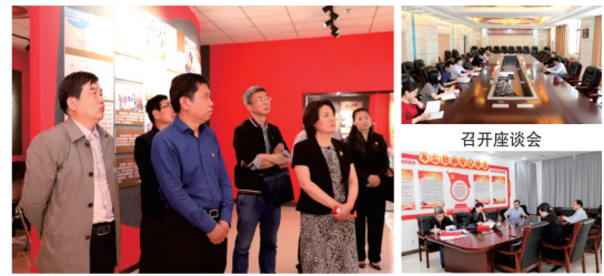
参观学习党史学习教育基地——青年杨靖宇纪念馆

入调查研究实情、办好实事出实招、健全机制求实效的要求，在实践活动中体现为民情怀，做到学史力行、锤炼过硬党性。六要规范组织生活，要高标准召开“两个生活会”。高标准组织主题活动，高水平讲好主题党课，在高质量的组织生活中，强化责任担当，做到鉴往知来，勇担职责使命。